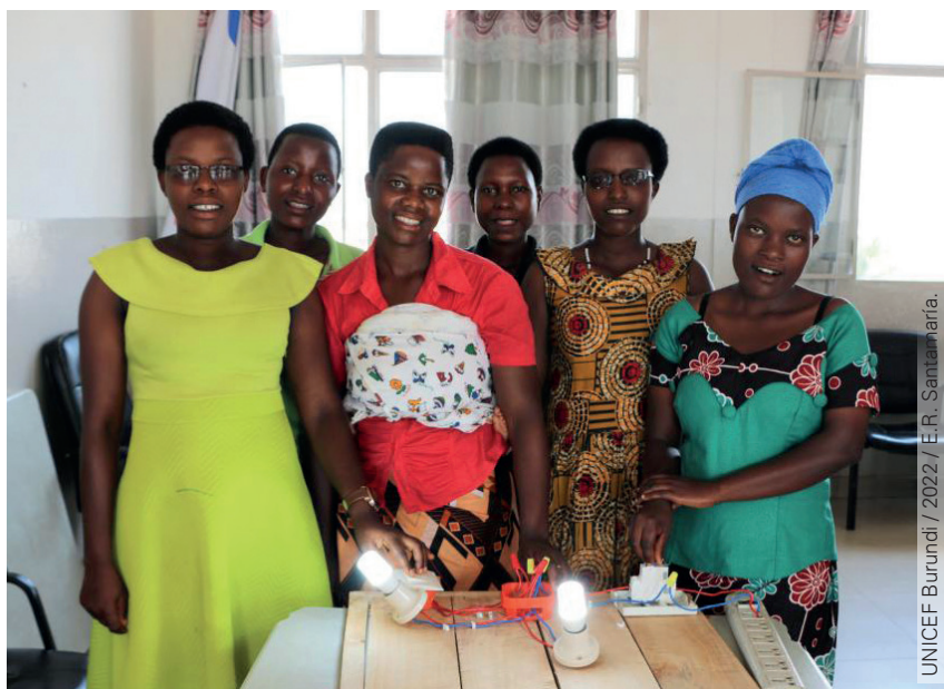
Groupe présentant ses ampoules opérationnelles.