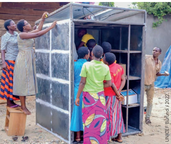
Groupe recevant une formation sur les stands solaires.

50 000 adolescents et jeunes (27 500 filles et 22 500 garçons) ont accès à des compétences et à des ressources économiques et sociales pour soutenir leurs activités de subsistance.