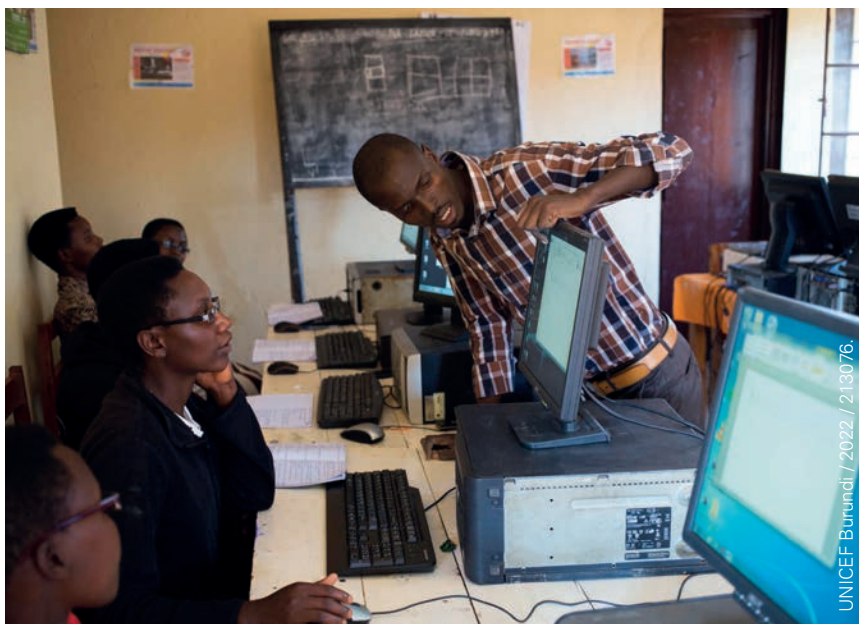
Groupe recevant une formation technique.

adolescents, dont 60% de filles ont eu accès à des formations financières, du coaching et des micro-prêts pour soutenir leurs activités entrepreneuriales.