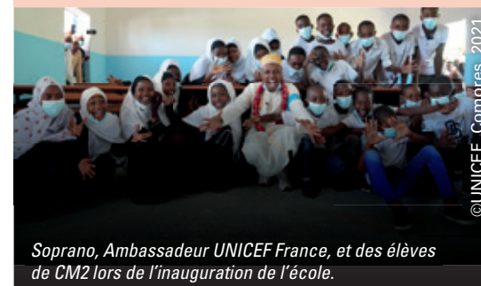
Soprano, Ambassadeur UNICEF France, et des élèves de CM2 lors de l'inauguration de l'école.

“ J'espère que chaque enfant arrivera à exaucer son plus grand rêve ”