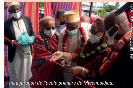
Inauguration de l'école primaire de Mwemboidjou.

“ L'enfance c'est le futur, l'avenir ; si tu donnes, ils donneront demain ; c'est comme ça qu'on construit un monde meilleur ”